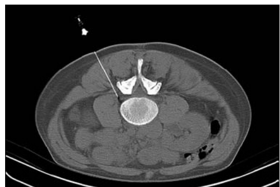
CT-gesteuerte periradikuläre Therapie